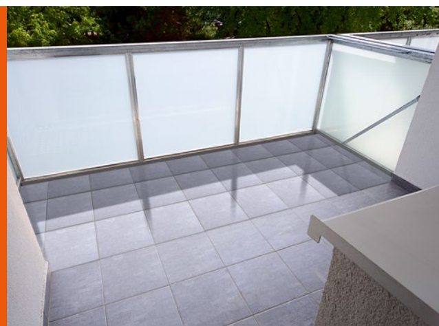
Sjednocená podlaha mrazuvzdornou dlažbou do jedné roviny.