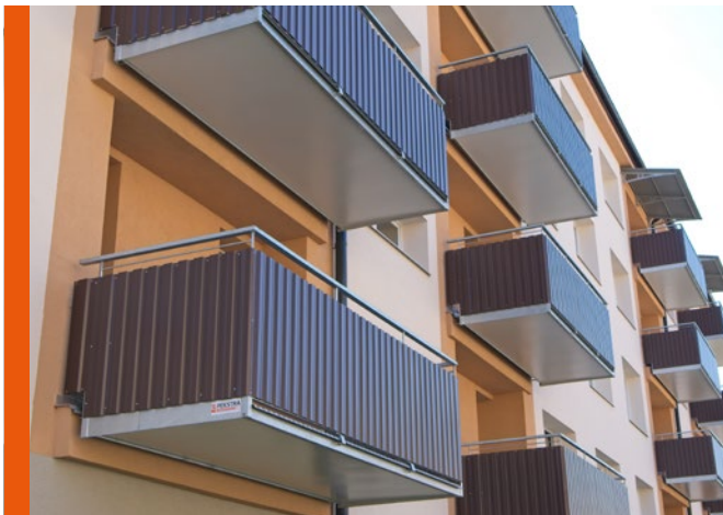
Balkón s výplní trapézovým plechem a odsazeným horním madlem.

Rošířením získáte prostor, který překvapí svojí velikostí a světlostí.